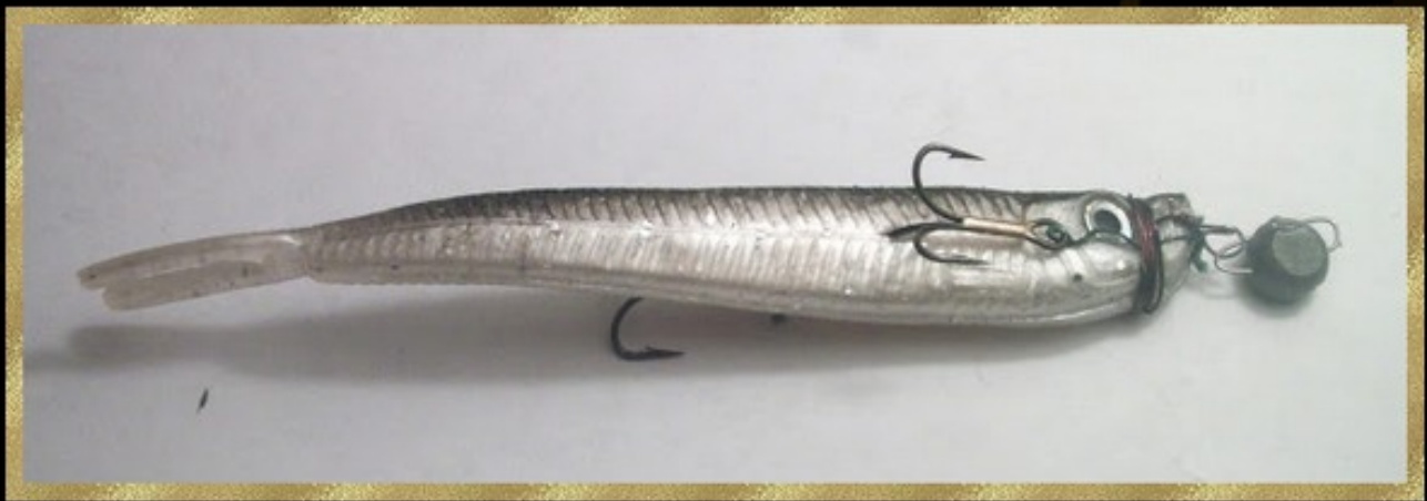
Bouquet sur Drachko...